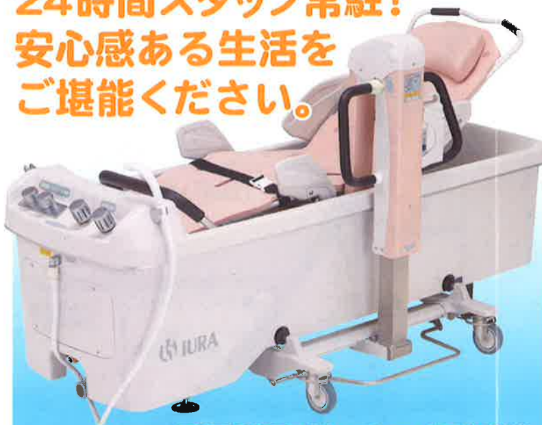
最新型入浴用ストレッチャー・バスタブ導入