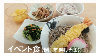
イベント食(例:年越しそば)