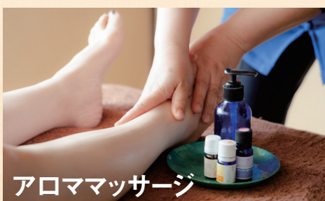
アロママッサージ

アロママッサージで副交感神経優位な状態 でよりリラックスでき、前向きで健康的な気持 ちと環境を創出します。