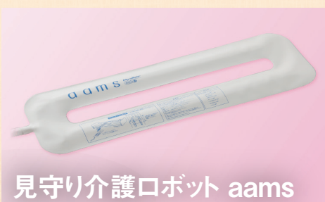
見守り介護ロボット aams

アロママッサージで副交感神経優位な状態 でよりリラックスでき、前向きで健康的な気持 ちと環境を創出します。