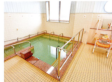
一般浴 (京都北大路)