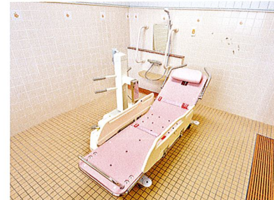
機械浴 (京都北大路)