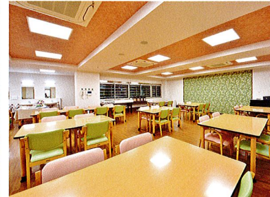
食堂兼機能訓練室 (京都北大路)