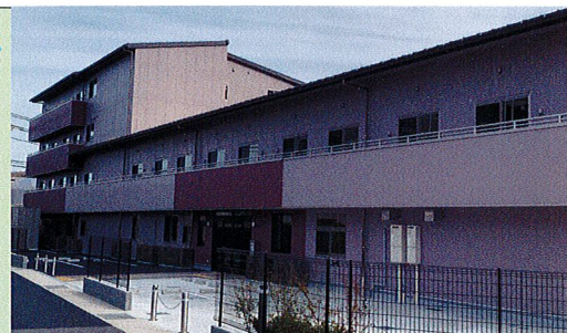
ベストライフ京都松尾(2020年9月撮影)

ベストライフ京都松尾 | 〒615-8205 京都府京都市西京区松室中溝町34-1 TEL:075-383-1070 FAX:075-383-1071