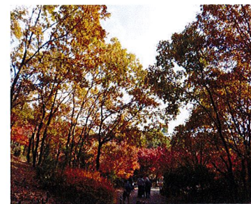
外出レク：宇治植物園 (ベストライフ京都桃山)

ベストライフ京都松尾では毎日をより豊かにお過ごしいただくため、お誕生会やお花見などの季節の行事をはじめとして、さまざまなイベントやレクリエーションの企画、プロの講師を招いての音楽療法やチェアエクササイズなど、健康維持のためのプログラムも取り入れています。