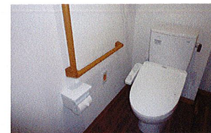
温水洗浄トイレ (ベストライフ京都松尾)