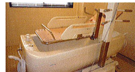
機械浴 (ベストライフ京都松尾)