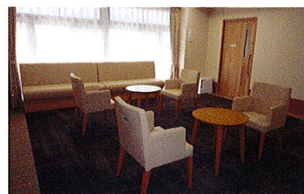
談話コーナー (ベストライフ京都松尾)