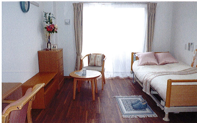
居室イメージ (ベストライフ京都松尾)