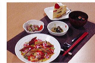
お楽しみ食(穴子ちらし寿司とお吸い物)