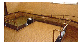
一般浴 (ベストライフ京都松尾)

語らいつながら入浴を楽しめる、大浴場タイプの一般浴と、寝たきりの方でもご入浴いただける機械浴があります。安全に着替えや移動、入浴ができるよう、さまざまな配慮がされています。