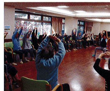
チェアエクササイズ (ベストライフ西宮)