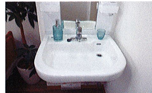
車いす対応洗面台 (ベストライフ京都松尾)