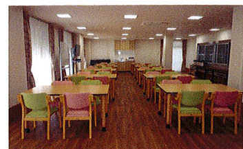
食堂 (ベストライフ京都松尾)

共用設備 食堂兼機能訓練室や談話コーナーでは仲間同士の交流を深めていただけます。健康管理室では看護職員が中心となりご入居者の健康管理やさまざまな健康相談をお受けし、ヘルパーコーナーでは、介護職員がご入居者の暮らしをサポートします。