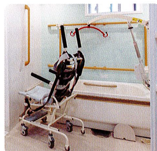
※写真は当グループの既存施設です