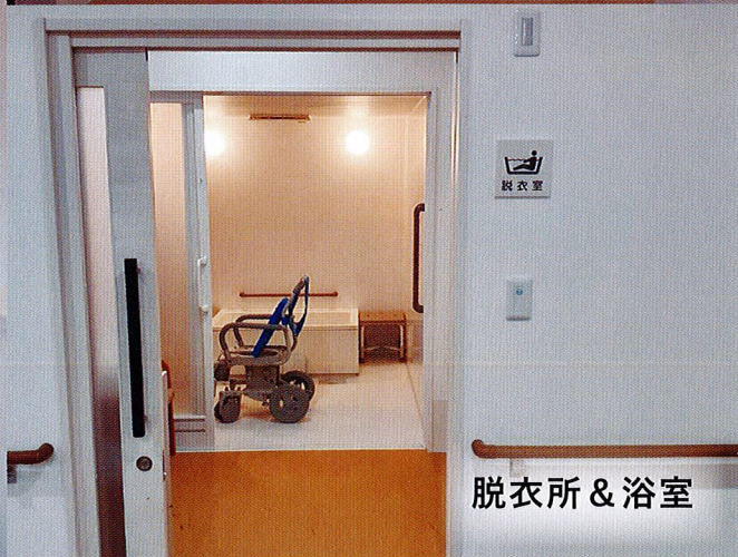
脱衣所 & 浴室