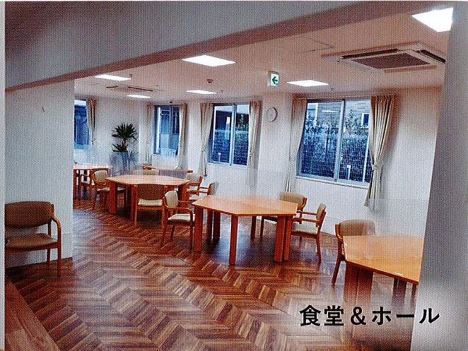
食堂 & ホール