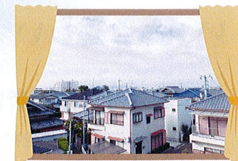
東山の暖かな景色が一望出来ます