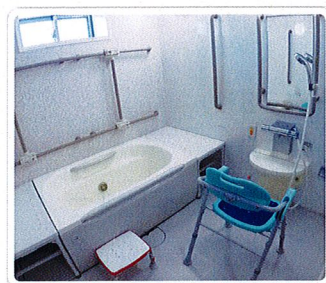
個室でゆったり1日の疲れを洗い流せます