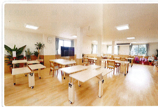
広くゆったりしたスペースで木の香りに包まれます