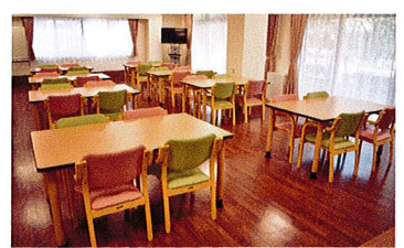
食堂(ベストライフ宝塚)

食堂や談話コーナーでは仲間同士の交流を深めていただけます。健康管理室では看護スタッフが中心となりご入居者様の健康管理やさまざまな健康相談をお受けし、ヘルパーステーションでは、介護スタッフがご入居者様の暮らしをサポートします。