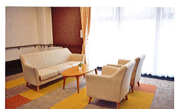
談話コーナー(ベストライフ宝塚)