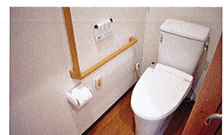
温水洗浄トイレ(ベストライフ宝塚)