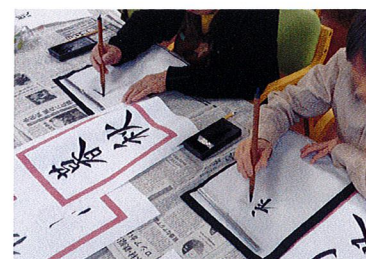
習字(ベストライフ宝塚)

ベストライフ奈良では毎日より豊かにお過ごしいただくため、お誕生会や季節の行事、プロの講師を招いての音楽療法やチェアエクササイズなど、さまざまなイベントやレクリエーションを予定しています。