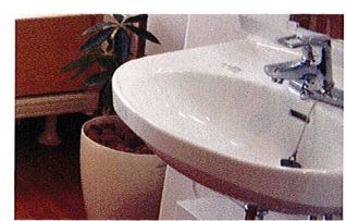
車いす対応洗面台(ベストライフ宝塚)