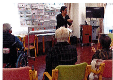
音楽療法(ベストライフ宝塚)