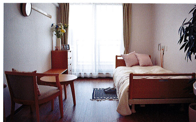
居室イメージ(ベストライフ宝塚)