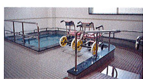
一般浴(ベストライフ宝塚)

語らいながら入浴を楽しめる、大浴場タイプの一般浴と、寝たきりの方でもご入浴いただける機械浴があります。安全に着替えや移動・入浴ができるよう、さまざまな配慮がされています。