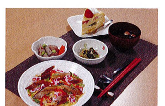
お楽しみ食(穴子ちらし寿司とお吸い物)