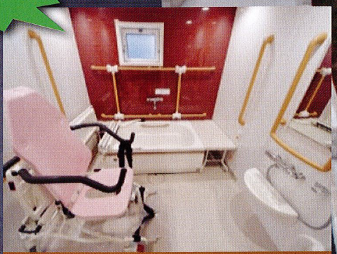
快適な入浴へのこだわり