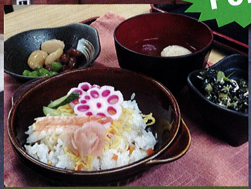
食事の質にこだわっています