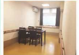
*家具類はイメージです。サービス付き高齢者向け住宅