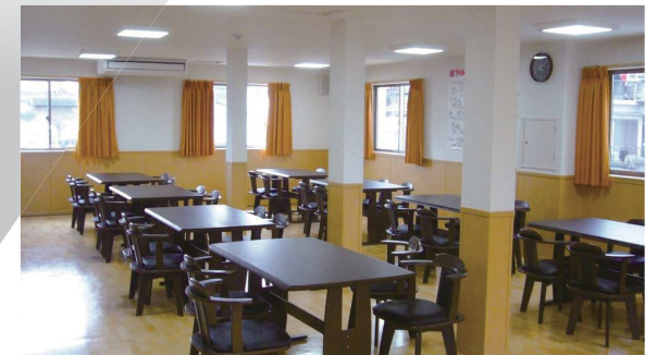
BGMが流れる、ゆったりとした食堂・コミュニティスペース。各種イベントも開催。