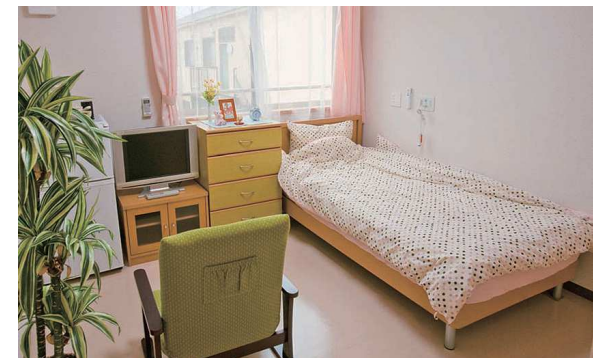
部屋は明るく、エアコンもカーテンもついています。