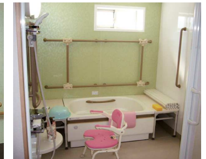
プライバシー重視で楽しく入浴