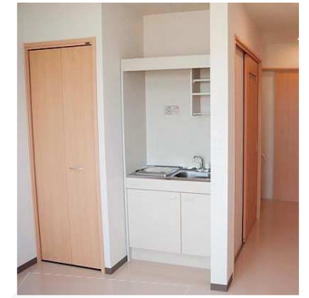
全室クローゼットとミニキッチン完備