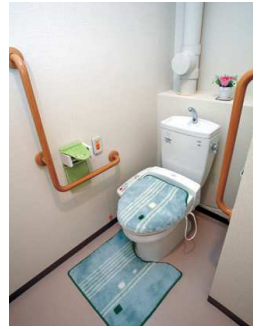
トイレは、車イスでもラクラク利用OK