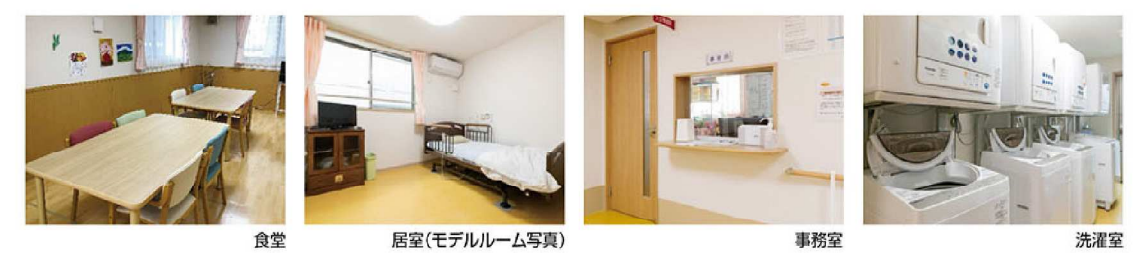
※家具レイアウトはイメージです。