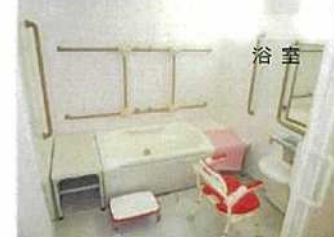
ゆったりと入浴できる浴室。手すり完備で安心して入浴していただけます。