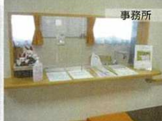
事務所には、スタッフが常駐しており、24時間365日入居者様を見守ります。