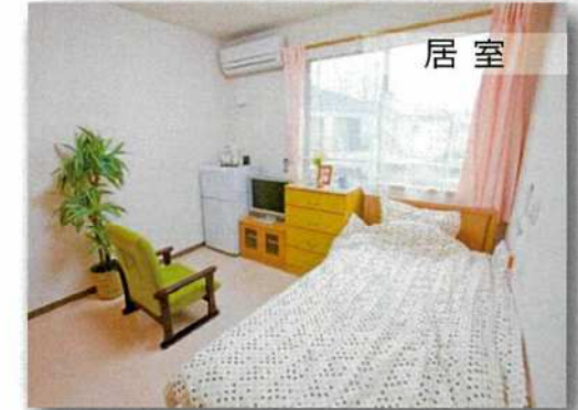
ゆったりとした完全個室。 プライベート空間でくつろいでいただけます。