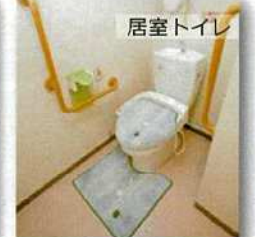
広々としたトイレは安心の手すり完備。