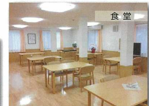
団楽の場所、食堂はお食事やレクリエーションなど、入居者様のコミュニティスペースです。