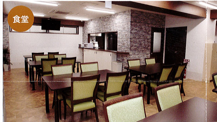
食堂 美味しい食事を快適な空間でおひとりお一人のお身体の状態に合わせて、個別対応したお食事を提供しています。