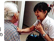
あんり訪問看護ステーションとの連携も充実。