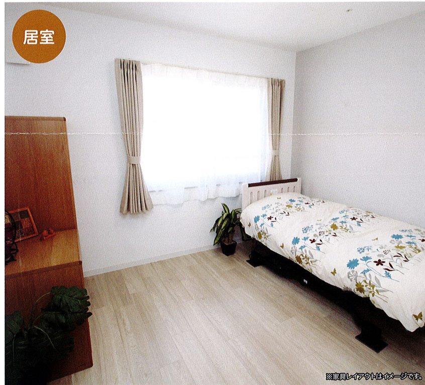
落ち着いたプライベート空間 明るい居室は自由にレイアウトして頂けます。