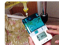
持続点滴の方も輸液ポンプで安心看護。

関連機関と連携をとり、ご利用者様が安心して豊かな療養生活を送るための様々な支援や調整をいたします。