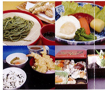
リハビリ目的の歩行練習や昇降運動などが行えます。季節に応じた豊富なメニューを提供します。