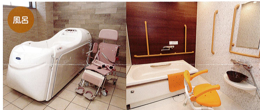
風呂 施設内に特殊浴槽1つ、3か所の浴室、安心・安全の想いに応える快適な「お風呂」。重度のご利用者様もゆったり入浴できるスペースがあります。また、介助者とご利用者が向かい合える「対面入浴」が可能ですので安心・安全にリラックスしてご入浴頂けます。