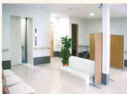
E 車椅子で乗り降りしやすいエレベーターホール(1・2階)