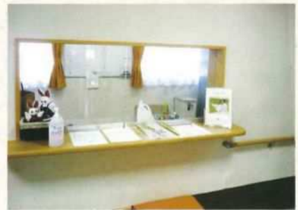
Ⓒ 事務所には24時間スタッフが常駐(1階)