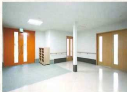
Ⓑ 広々としたエントランス(1階)