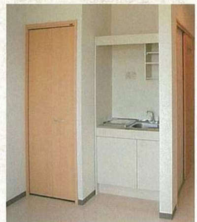
電気コンロ付キッチン

※写真はモデルルームのため、実際の居室とは異なります。 ※モデルルームの写真・図面に掲載されている家具等の備品は月額料金に含まれません。 ※居室により間取りが異なります。本間取りは、2階居室です。 ※1階にはバルコニーはございません。