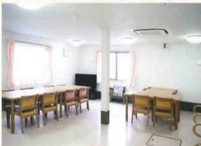
Ⓐ 明るく広々とした食堂(1階)