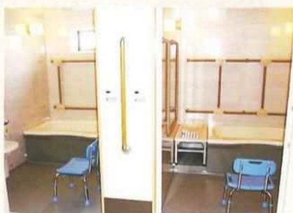
D 介助しやすい安心の介護用大型浴室(1階)