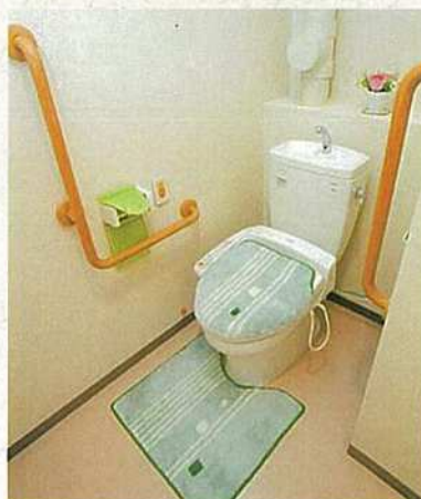
車椅子仕様のトイレ