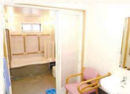
F 個室浴室を完備(1階)