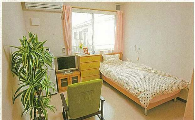
ゆったりと快適に過ごせる居室