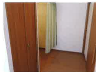
居室クローゼット