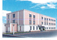
ハートランド 高槻