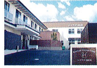
ハートランド 富田林