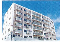
ハートランド 西淀川