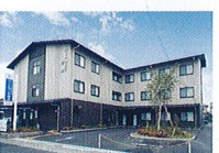
ハートランド 奈良