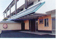
ハートランド 羽曳野