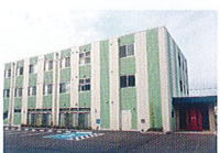
ハートランド 和歌山