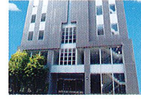
ハートランド 布施