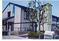
ハートランド 北花田