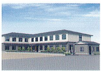
ハートランド 湖西