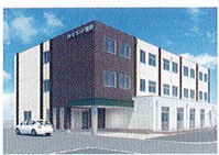
ハートランド 瀬田