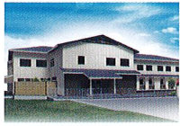
ハートランド 岩倉