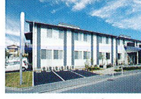
ハートランド 守口