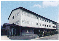
ハートランド 山科