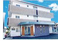
ハートランド 東大阪