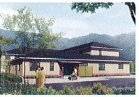
ハートランド 洛北