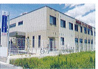
ハートランド 南志賀