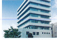
ハートランド 淀川