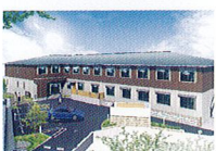
ハートランド 生駒