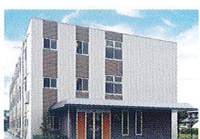
ハートランド 倉敷