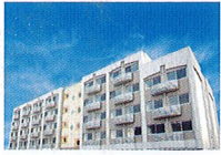
ハートランド 枚方