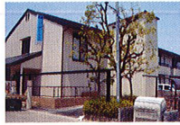
ハートランド 北花田