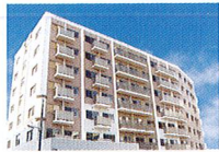
ハートランド 西淀川