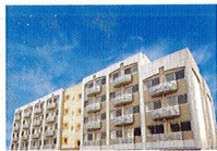
ハートランド 枚方