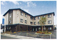
ハートランド 奈良