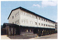
ハートランド 山科