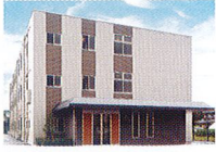
ハートランド 倉敷