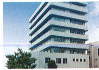
ハートランド 淀川