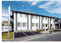
ハートランド 守口