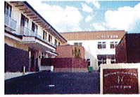
ハートランド 富田林