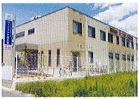
ハートランド 南志賀