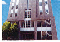
ハートランド 布施