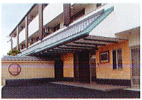
ハートランド 羽曳野