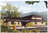
ハートランド 洛北