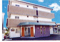
ハートランド 東大阪