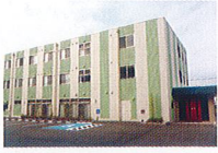
ハートランド 和歌山