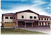
ハートランド 岩倉 2017年7月OPEN