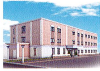
ハートランド 高槻