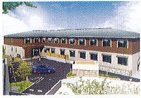
ハートランド 生駒