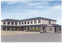
ハートランド 湖西