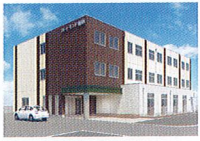
ハートランド 瀬田