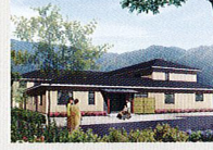
ハートランド 洛北