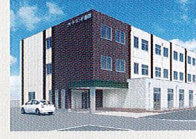
ハートランド 瀬田