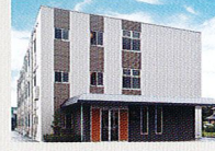
ハートランド 倉敷