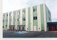
ハートランド 和歌山