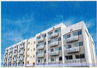
ハートランド 枚方