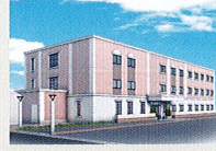
ハートランド 高槻