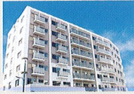
ハートランド 西淀川