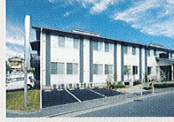
ハートランド 守口