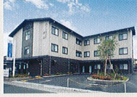
ハートランド 奈良