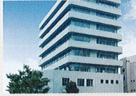
ハートランド 淀川