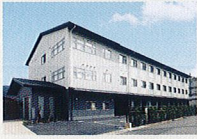
ハートランド 山科