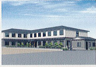
ハートランド 湖西