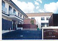
ハートランド 富田林