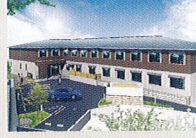
ハートランド 生駒