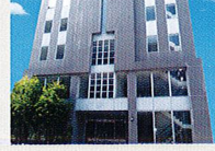
ハートランド 布施