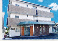
ハートランド 東大阪