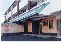
ハートランド 羽曳野