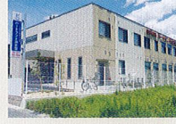
ハートランド 南志賀