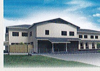
ハートランド 岩倉