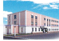
ハートランド 高槻