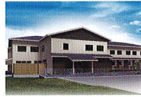
ハートランド 岩倉 2017年OPEN