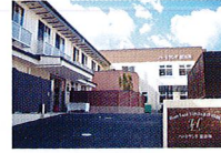
ハートランド 富田林