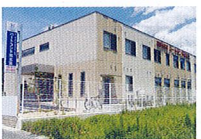
ハートランド 南志賀