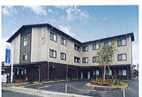
ハートランド 奈良