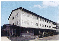
ハートランド 山科