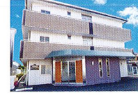
ハートランド 東大阪