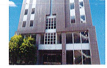
ハートランド 布施