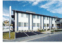
ハートランド 守口