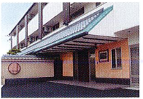
ハートランド 羽曳野