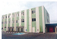
ハートランド 和歌山