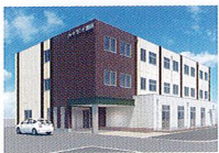
ハートランド 瀬田