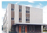
ハートランド 倉敷