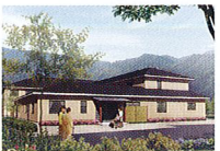
ハートランド 洛北