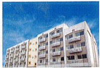
ハートランド 枚方