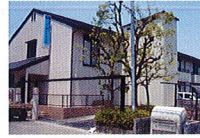
ハートランド 北花田