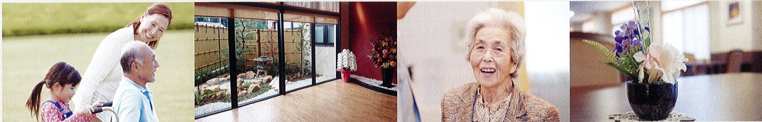
※写真は川商グループ施設の設備及びイメージです。各施設によって形状・色は多少異なります。