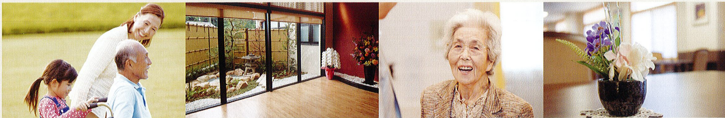
※写真は川商グループ施設の設備及びイメージです。各施設によって形状・色は多少異なります。