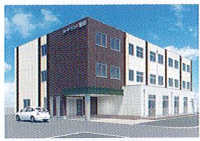
ハートランド 瀬田