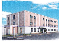
ハートランド 高槻