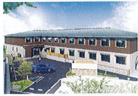
ハートランド 生駒