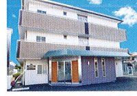
ハートランド 東大阪