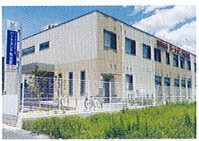
ハートランド 南志賀