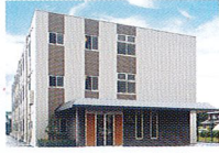
ハートランド 倉敷