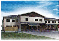
ハートランド 岩倉 2017年OPEN