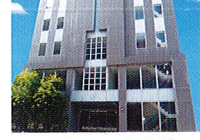
ハートランド 布施