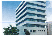
ハートランド 淀川