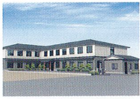
ハートランド 湖西