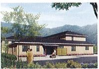
ハートランド 洛北