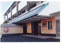
ハートランド 羽曳野