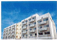
ハートランド 枚方