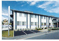
ハートランド 守口