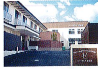
ハートランド 富田林