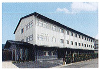
ハートランド 山科