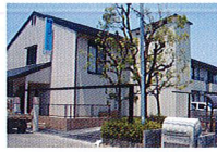
ハートランド 北花田