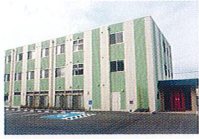
ハートランド 和歌山