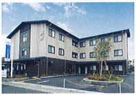
ハートランド 奈良