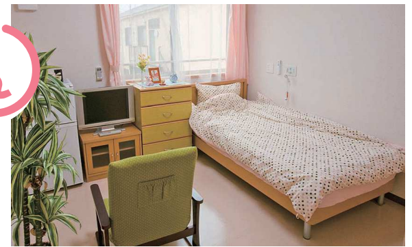
部屋は明るく、エアコンが付いて快適。また、窓からの景観も素晴らしいです。