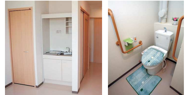
全室クローゼットとミニキッチン完備