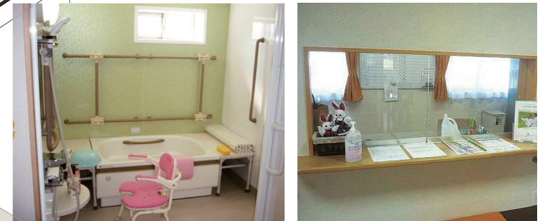
プライバシー重視で楽しく入浴いただけます。