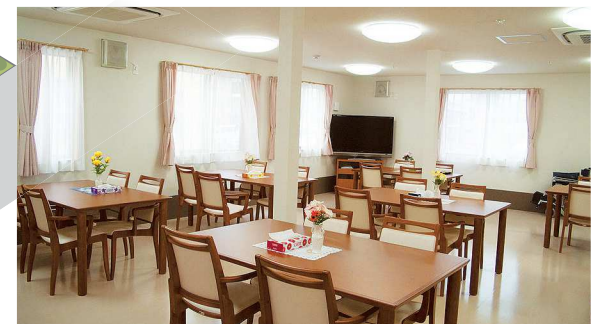
BGMが流れる、ゆったりとした食堂・コミュニティスペース。各種イベントも開催いたします。