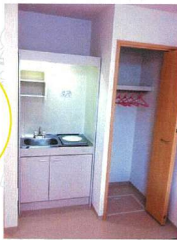
※居室の写真はイメージ写真です。