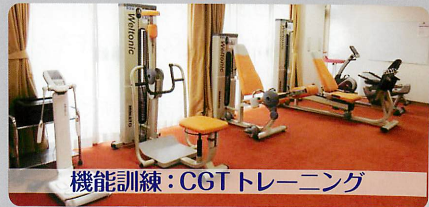
機能訓練：CGTトレーニング