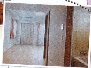
大人気の2人部屋には、キッチン・浴室も完備