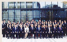
2014年度新入社員入社研修