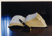
新約聖書マタイの福音書22章39 「あなたの隣人をあなた自身のように愛せよ」