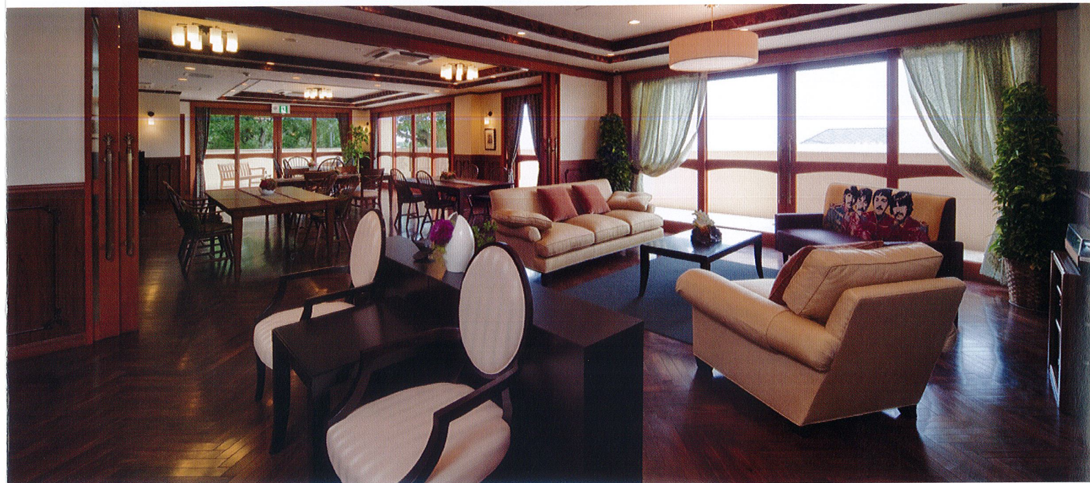
ダイニングルーム 窓が大きく、開放的で広々としたダイニングルーム。皆さま憩いのひと時を心地よくお過ごしです。