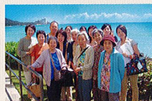
2005年、初めての海外旅行 ハワイにて