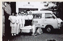
1986年当時、まごころ一号車 (訪問入浴車) 前での写真