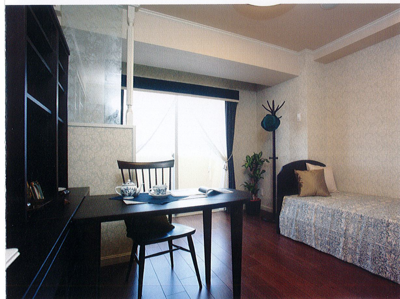
居室 自然光がたっぷりと降り注ぐ明るい居室は、のんびりと読書などを楽しむ快適な空間です。