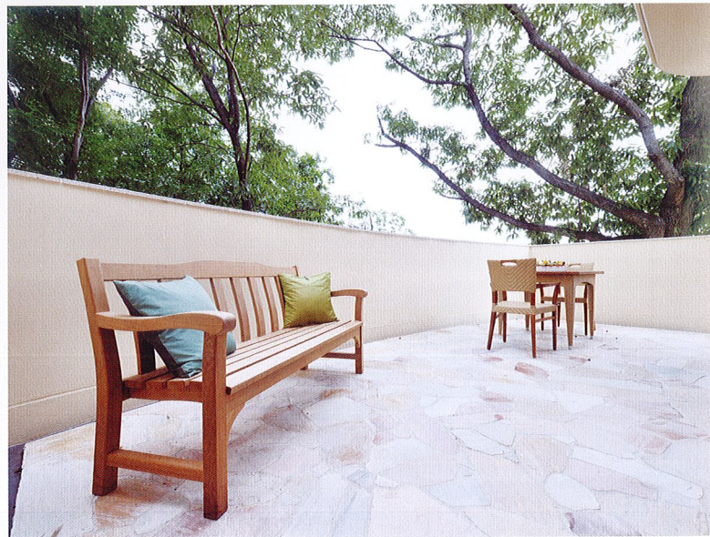
テラス ダイニングルームの窓を開ければ、テラスがお目見え。晴れた日はベンチに腰掛け、四季の移ろいを楽しめます。

心豊かなセカンドライフの創造をめざし、「文化・空間・ケア」の3つを柱にした理想的な新しい介護のカタチに取り組んでいます。