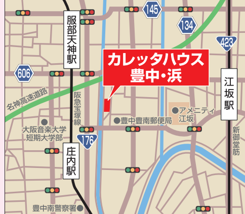
阪急庄内駅徒歩15分