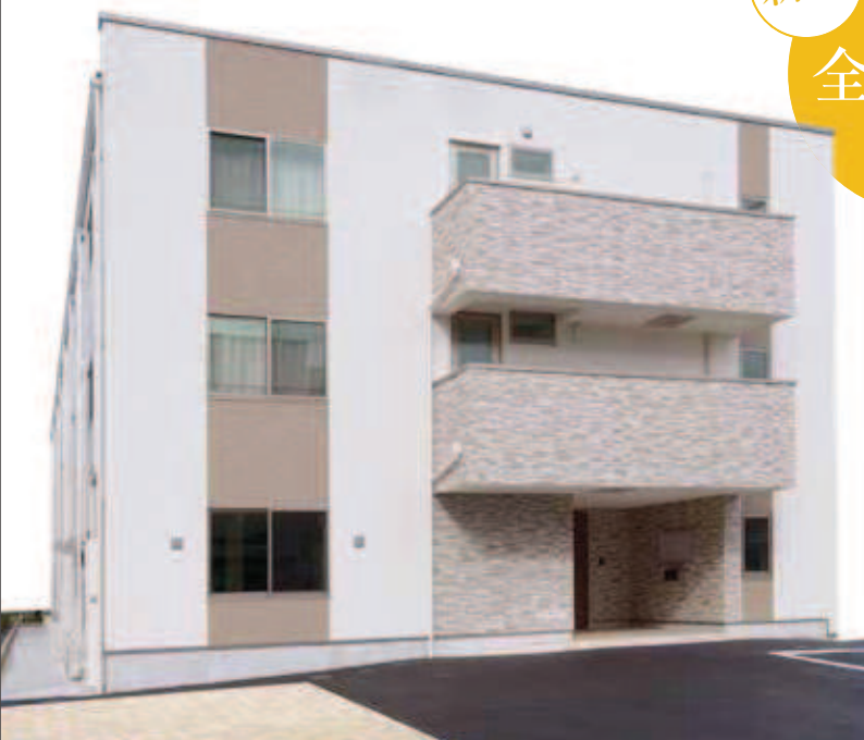
写真は竣工事例です。実際とは異なります。