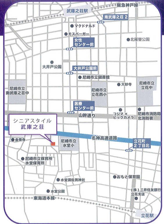
J R 立花駅徒歩12分 武庫之荘駅徒歩13分

建物延床面積(㎡) 2230.60㎡ 事業主体 株式会社シニアスタイル 構造・規模 造 地上階 鉄骨造5階建 居室数(室) 60 居室面積(㎡) 18.00(室) 共有室 食堂、機能訓練室、相談室、浴室 開設年月日 平成 29年 4月