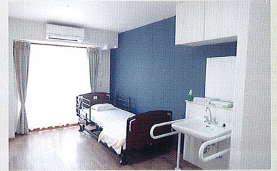
衛生的にも管理された居室