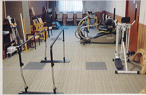
充実したリハビリルーム