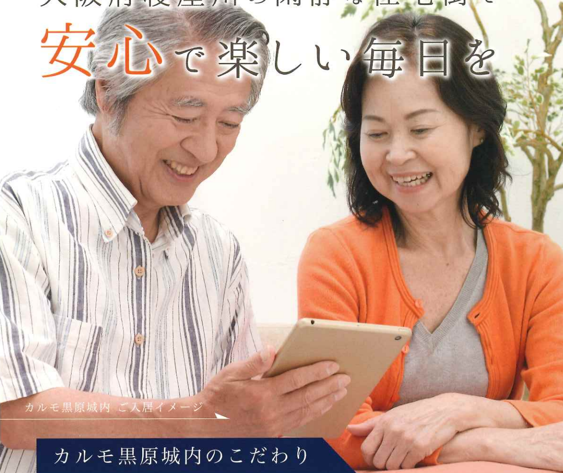
カルモ黒原城内 ご入居イメージ