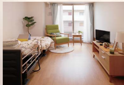
自分の時間が楽しめるプライベートルーム