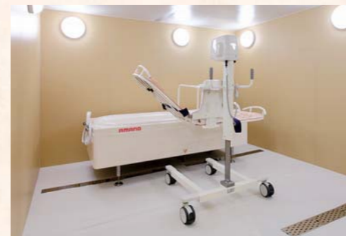
入浴が難しい方でも入浴可能な機械浴槽完備