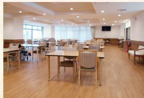
会話が弾む、ゆったりとした食堂スペース