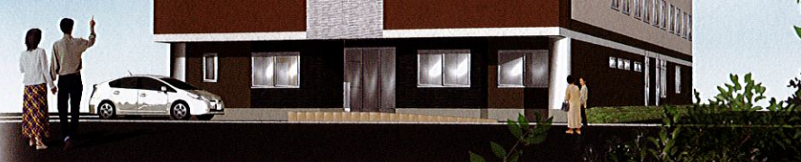
スイートガーデン枚方 完成イメージパース