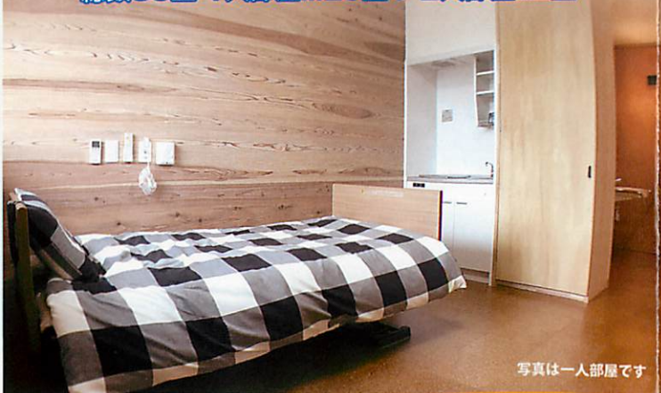
写真は一人部屋です