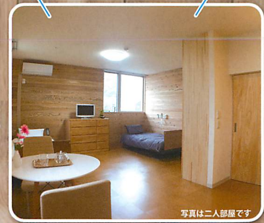
写真は二人部屋です

大きな湯船はゆったりと足をのばしてご入浴頂けます。浴槽室は2タイプ。浴室は3室ご用意しました。