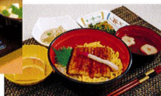
行事食(土用の丑の日)