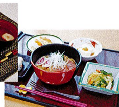
郷土料理(和歌山県)