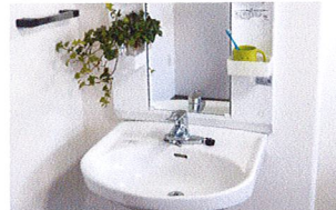
車いす対応洗面台