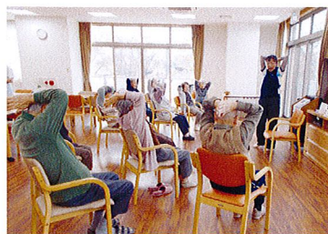
チェアエクササイズ