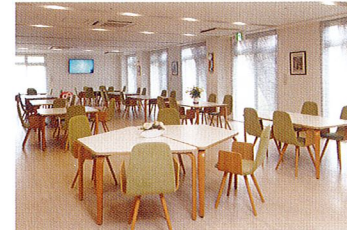
会話がいつそうはずむ開放的な食堂