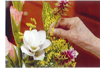
フラワーアレンジメント

シュールメゾン神田は、ただ住むだけのホームではありません。 ご入居者さまの心が休まる時間や さまざまなことが出来るチャンスにあふれています。 彩りのある毎日は、ホームに住む心地よさにつながっていきます。