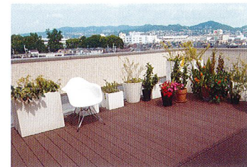
自然を感じられる大人気のテラス