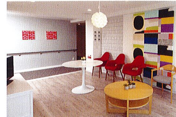
入居者様同士の交流が広がる談話室