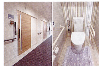
快適に利用できる工夫を