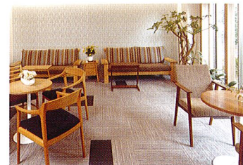
明るい雰囲気のエントランス

シュールメゾン神田は、全面段差のないバリアフリー構造。 要所に手すりを設置する日常の動作に配慮した住まいです。 24時間ケアスタッフの見守りや医療の受け入れなど 暮らしに安心を備えながら自由に居心地の良い生活を送っていただけます。