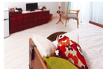
室内は明るくバリアフリーに