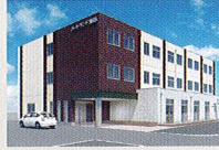
ハートランド 瀬田