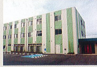
ハートランド 和歌山