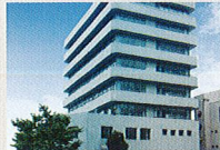
ハートランド 淀川