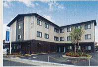
ハートランド 奈良