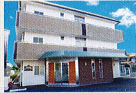
ハートランド 東大阪