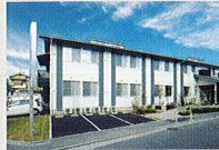
ハートランド 守口