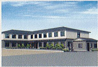
ハートランド 湖西