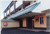
ハートランド 羽曳野