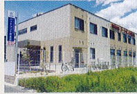
ハートランド 南志賀