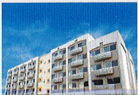
ハートランド 枚方