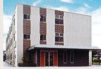
ハートランド 倉敷