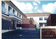
ハートランド 富田林