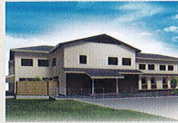
ハートランド 岩倉