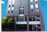
ハートランド 布施