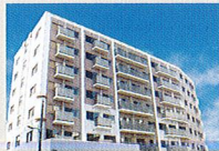
ハートランド 西淀川