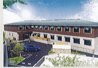
ハートランド 生駒