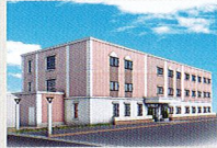
ハートランド 高槻