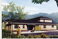
ハートランド 洛北