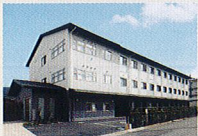
ハートランド 山科