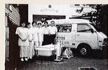
1986年当時、まごころ一号車 (訪問入浴車) 前での写真