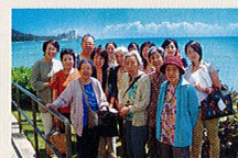
2005年、初めての海外旅行 ハワイにて