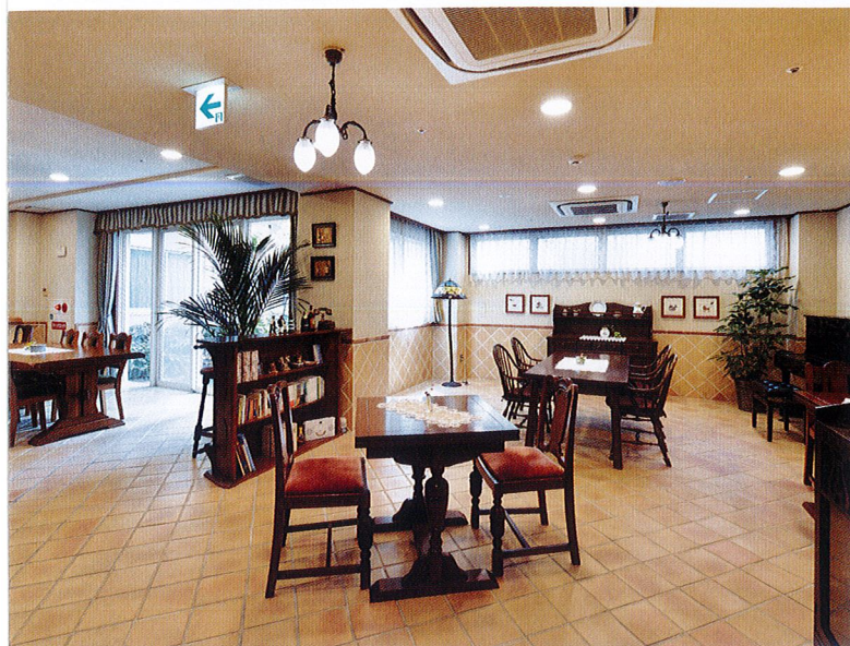
リビングルーム ダークブラウンのインテリアがシックな印象のリビング。カフェのような雰囲気の中で、おくつろぎいただけます。