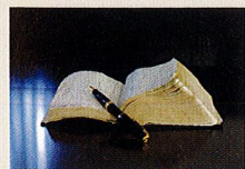
新約聖書マタイの福音書22章39 「あなたの隣人をあなた自身のように愛せよ」

ホテルではない、病院でもない、シニアマンションや自宅では得られないもの、すべてのセカンドライフの必要を満たした品質とサービスと理念がそこに存在しますか？