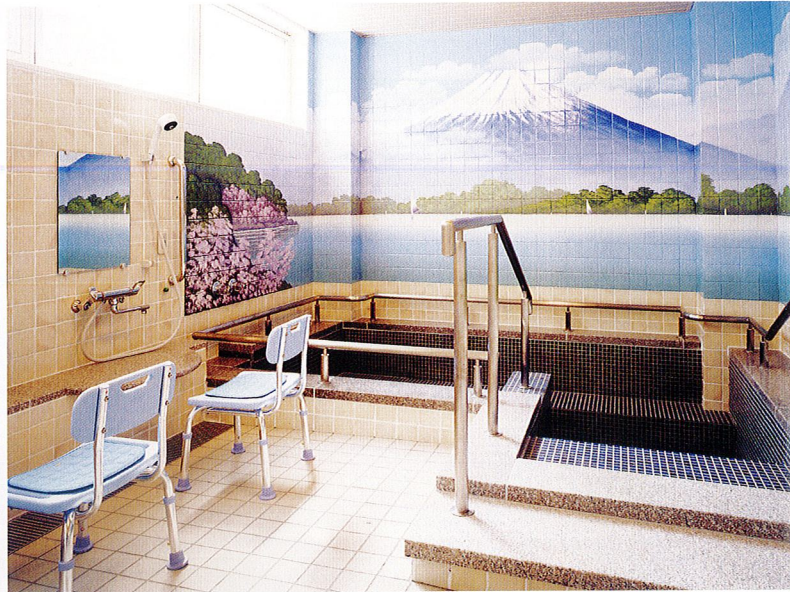
大浴場 銭湯絵師が描いた大きな富士山の壁絵に迎えられ、懐かしい銭湯のような雰囲気をお楽しみいただけます。