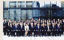
2014年度新入社員入社研修