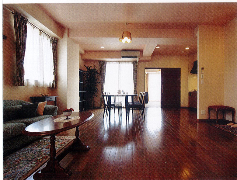
居室 のんびりとお好きなことを楽しめる明るい居室。ライフスタイルやお身体の状態に合わせて居室タイプをお選びいただけます。