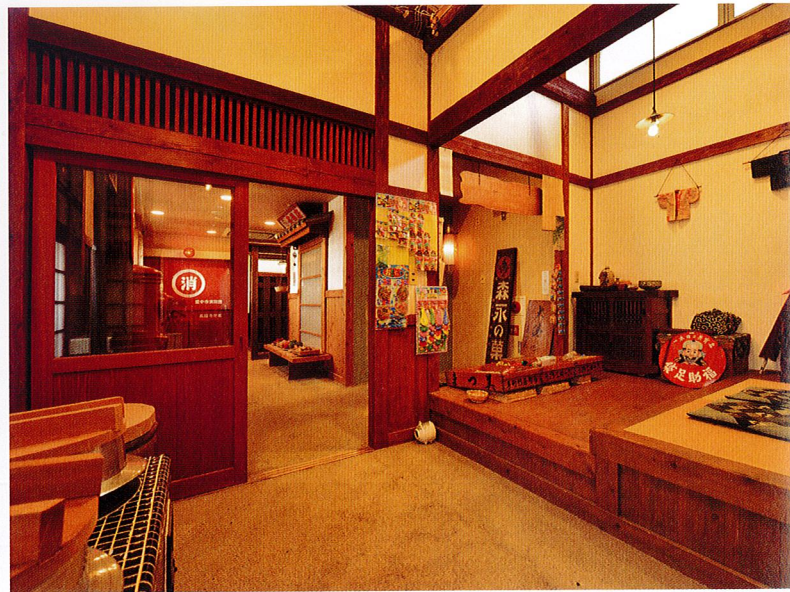
ぶらぶら横丁 昔の記憶を呼び起こす「回想療法」の一環としてホームの一角に昭和の街並みを再現しています。