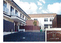
ハートランド 富田林