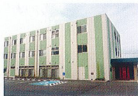
ハートランド 和歌山