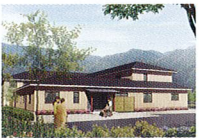
ハートランド 洛北