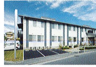
ハートランド 守口