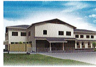
ハートランド 岩倉