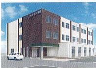
ハートランド 瀬田