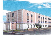
ハートランド 高槻