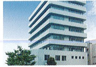
ハートランド 淀川