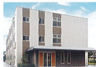
ハートランド 倉敷