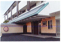
ハートランド 羽曳野