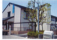
ハートランド 北花田