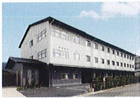
ハートランド 山科