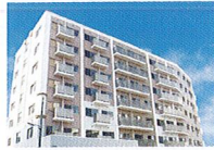
ハートランド 西淀川