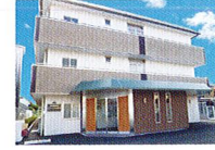
ハートランド 東大阪