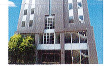
ハートランド 布施