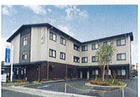
ハートランド 奈良