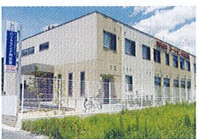
ハートランド 南志賀