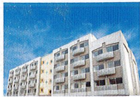
ハートランド 枚方