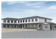
ハートランド 湖西