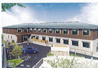
ハートランド 生駒