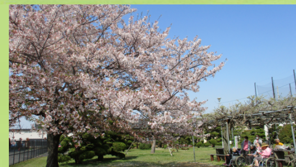
お花見イベントの様子です。