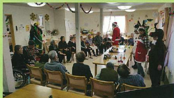
クリスマスパーティーイベントの様子です。