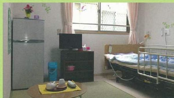
落ち着いた雰囲気のと風モデルルーム