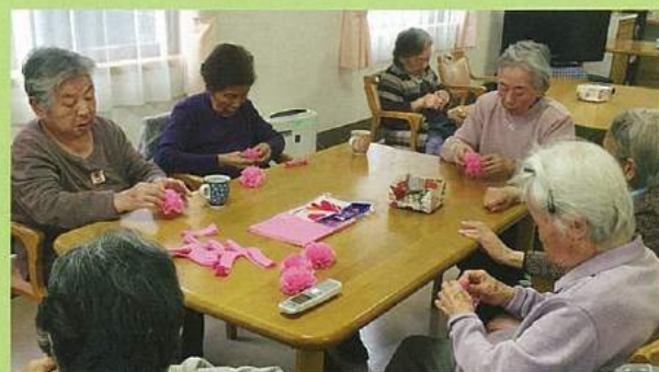
みんなで紙花づくりの様子です。