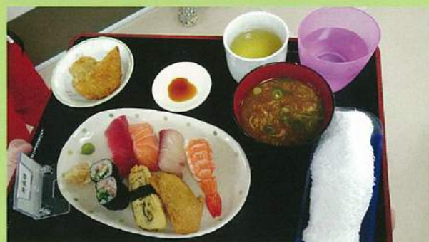
行事食にお寿司などもご提供させていただきます。