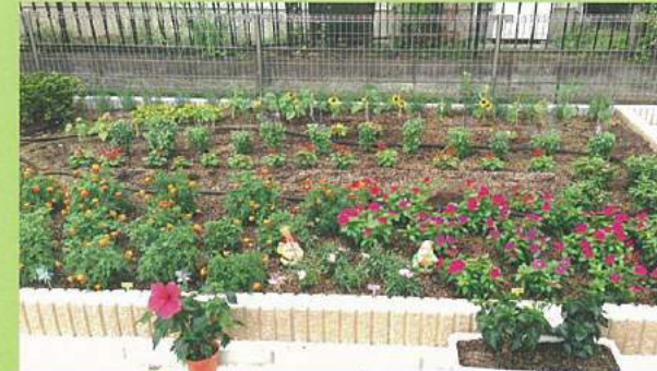
ガーデニングスペース