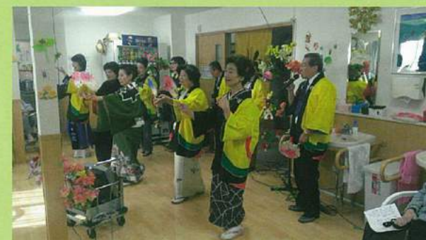
みんなで楽しく一緒に踊りのお稽古です。