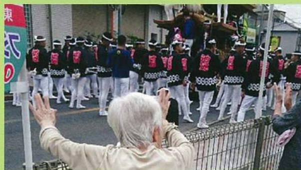
だんじりも観覧いただけます。