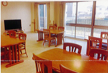
明るく開放的な食堂