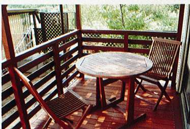
天気の良い日はウッドデッキで