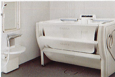
最新式の入浴装置