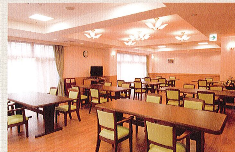
各所に椅子やテーブルを設置。食堂や談話室は自由にご利用可能です。居室以外にも居場所がたくさんあります。