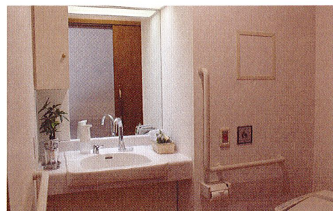
【洗面台】蛇口は自動水栓です。 【温水洗浄便座付トイレ】介助バー、コールボタンを設置