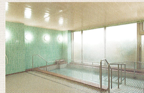
一般浴のほか、家庭のお風呂のような個別、寝たきりの方も入浴可能な特殊浴槽があり、お体の状態に合わせた入浴が可能です。