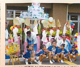
阿波踊り (本場徳島より阿波踊りの皆さんと子供たち)