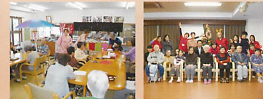
写真左から順に (そうめん流し、盆踊り、夏祭り、クリスマスパーティなど年間を通じて色んな行事を楽しんでいます/自由参加型)