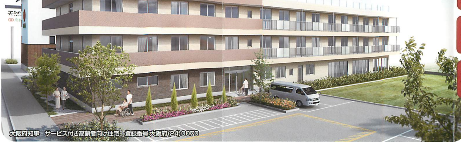
大阪府知事 サービス付き高齢者向け住宅 登録番号大阪府(24)0070