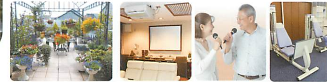
四季折々の草花が楽しめるガーデニング 多目的ルーム (シアター、カラオケ、トレーニング機器等設置)

提携医療機関との連携を密にしており、普段より入居者様の状態を把握し、体調管理を行っており、緊急の事態にもすばやく対応することができます。