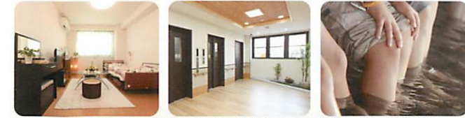
日当たりがよく清潔で快適性に優れた居室 広々としたエレベーター前エントランス 大浴場、足湯コーナーを設置