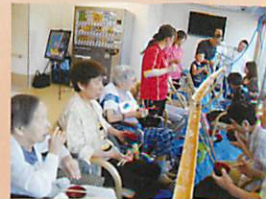
写真左から順に (そうめん流し、盆踊り、夏祭り、クリスマスパーティなど年間を通じて色んな行事を楽しんでいます/自由参加型)