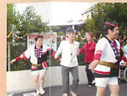
写真左から順に (そうめん流し、盆踊り、夏祭り、クリスマスパーティなど年間を通じて色んな行事を楽しんでいます/自由参加型)