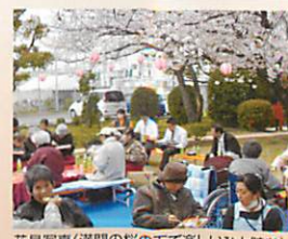
花見写真 (満開の桜の下で楽しいひとときを)