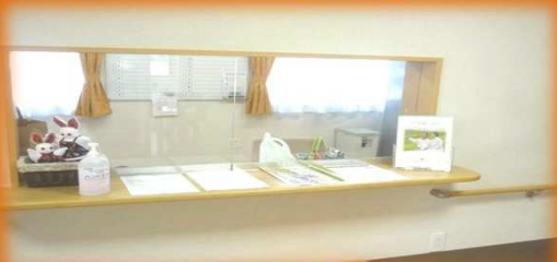
事務所/ヘルパーステーション

職員が24時間常駐。生活相談、安否確認、緊急時対応を行います。安心して暮らしていただける『お住まい』を提供します。