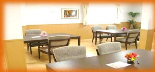
食堂・団欒スペース

ゆったりと楽しい空間で、おいしいお食事や楽しいおしゃべりを満喫してください。食堂には、余暇スペースを設け、カラオケや囲碁、将棋等を楽しんでいただけます。