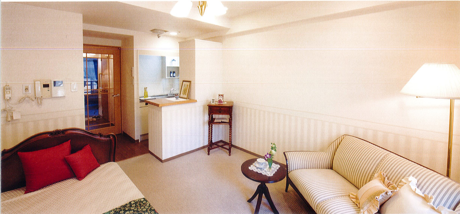
居室 ゆとりのあるスペースが魅力のマンションタイプのお部屋。のんびりとおくつろぎいただけます。