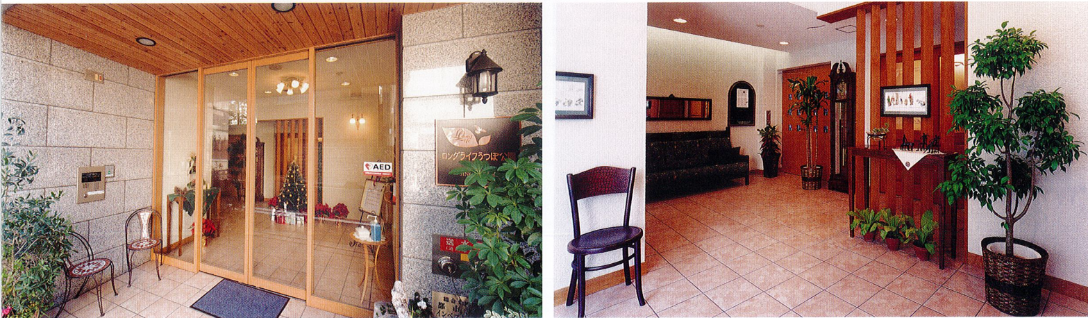
エントランス 落ち着いた雰囲気の内装やグリーンが住まう人々をあたたく出迎えてくれます。