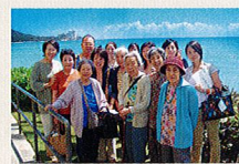
2005年、初めての海外旅行 ハワイにて