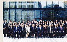
2014年度新入社員入社研修