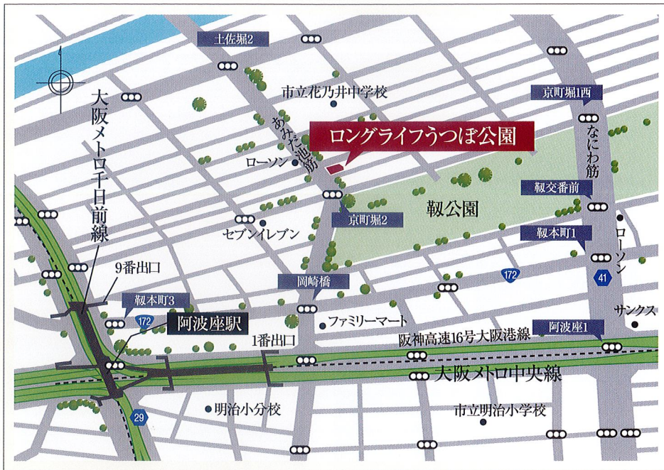
所在地 / 大阪府大阪市西区京町堀2-12-15

大阪の癒しスポット靱公園の近くに 「ロングライフうつぼ公園」はございます 都心部からも近く利便性の高いホームです