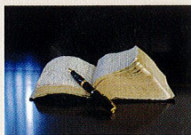
新約聖書マタイの福音書22章39 「あなたの隣人をあなた自身のように愛せよ」