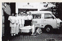
1986年当時、まごころ一号車 (訪問入浴車) 前での写真