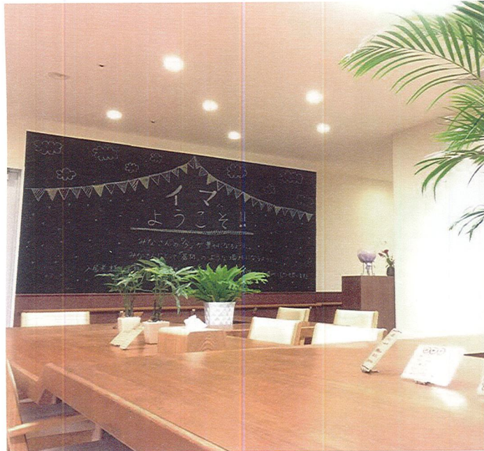
コミュニティスペース「イマ」

コミュニティスペース「イマ」でのイベント。体操や手芸教室などの定期的なイベントからバザーや夏祭りなどの大きなイベントまであります。