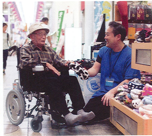
「おおきに!」「ほな、よろしゅう」 大阪人らしい活気が毎日の日常に彩を加えます

コミュニティスペース「イマ」でのイベント。体操や手芸教室などの定期的なイベントからバザーや夏祭りなどの大きなイベントまであります。