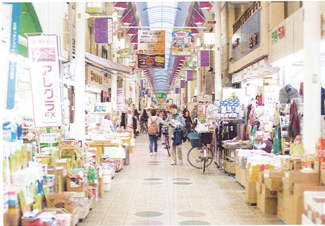
大阪三大商店街の一つの商店街、毎日大賑わいです

ライフエル駒川のすぐ西側には、お散歩やお買い物に便利な「駒川商店街」。地下鉄谷町線「駒川中野駅」も徒歩3分、近鉄南大阪線「針中野駅」も徒歩5分。ご本人様にとっても、ご家族様にとっても嬉しい便利な立地。