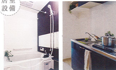
随所に手すりやナースコールもちろん完備

お体が不自由になりお一人でご利用いただくことが難しい方は、お風呂等の利用時に職員がお部屋までご訪問してお手伝いする「介護サービス」をご利用いただけます。