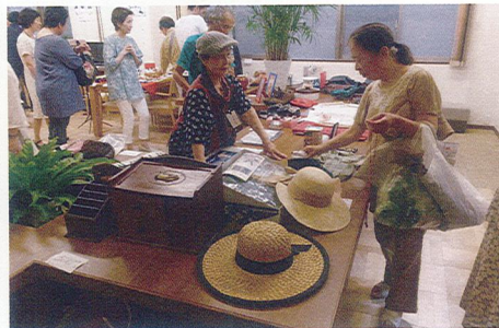
地域の方々主催のバザーを開催しました