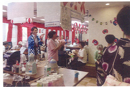
盆踊りや屋台を開いた夏祭り