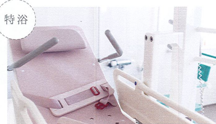
座位を保つことが難しい方でも安心してご入浴いただけます