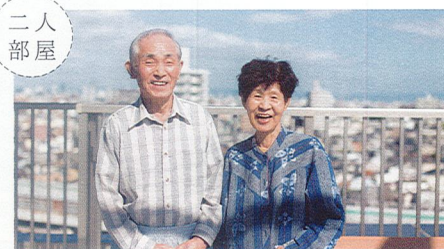
天気の良い日に屋上での1枚戸

ご夫婦一緒に お住まい いただけます。 いくつになっても、ご夫婦で暮らしたい。そんなご要望にお答えし、ライフエル駒川ではご夫婦部屋もご用意しております。