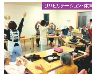
リハビリテーション・体操