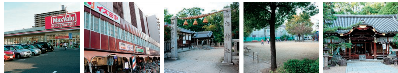
スーパー マックスバリュースーパー イズミヤ 若宮八幡宮 旭神社 加美正北ふれあい公園 杭全神社