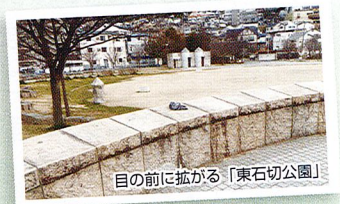
目の前に広がる「東石切公園」