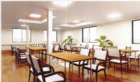
明るく開放的な食堂 多彩なイベントも行う憩いの場です。

館内には次亜塩素酸水を導入。 館内・居室の消毒、消臭や、 外部からの様々な菌を除菌する 効果があります。 皆様が安全に生活できるよう、 感染予防に努めております。